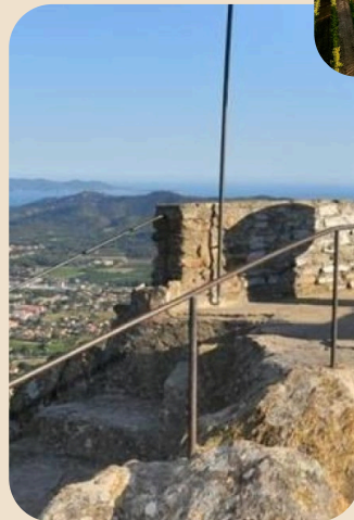
Unsere Liebe Frau von Constance