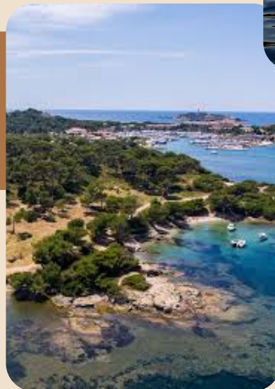
Besuch der Hyères-Inseln (Porquerolles, Levant, Port-Cros)