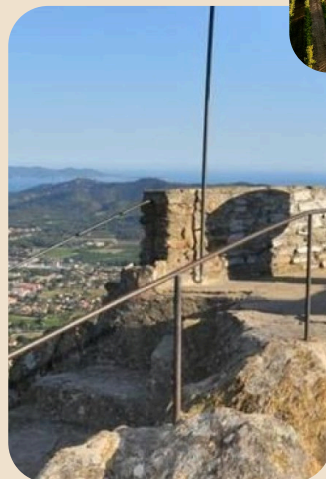
Notre Dame de Constance